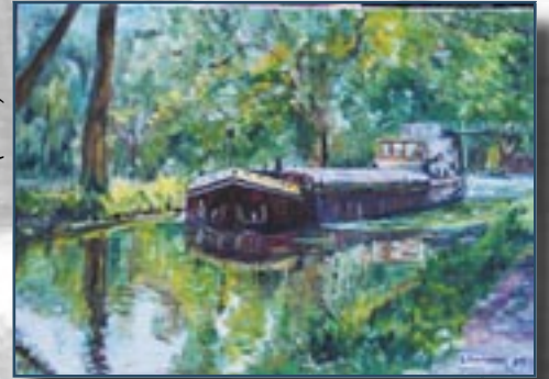
Automoteur Corona (2005)