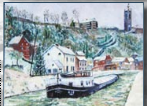
Débacle à Thuin